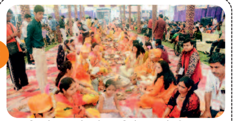
दीलचेयर और बैसाखी के सहारे लिए ...